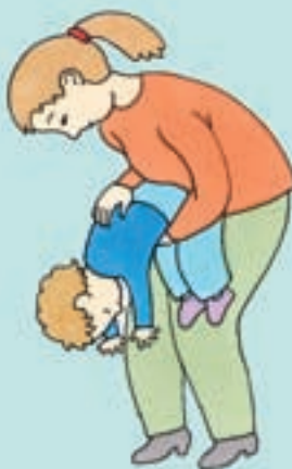
Hvis barnet er over 1 år

Ring 112, hvis du ikke kan få fremmedlegemet op, eller hvis barnet bliver bevidstløs.