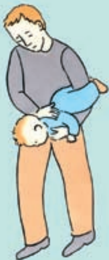
Hvis barnet er under 1 år

Hvis barnet er under 1 år og ikke trækker vejret eller ikke kan hoste, læg da barnet som vist på tegningen og giv 5 klask med flad hånd mellem skulderbladene. Hvis fremmedlegemet ikke kommer op, vend